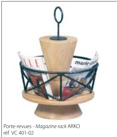
Porte-revues - Magazine rack ARKO réf VC 401-02