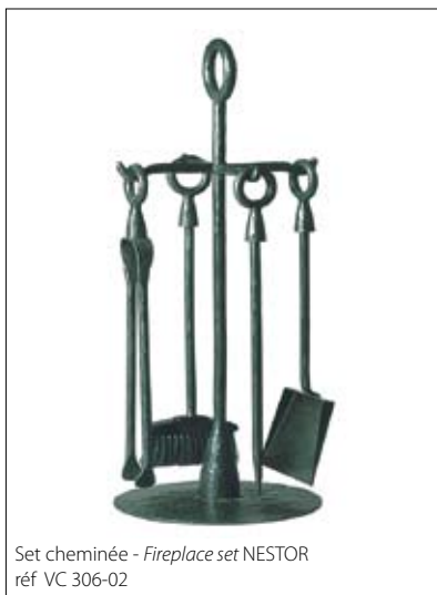
Set cheminée - Fireplace set NESTOR réf VC 306-02