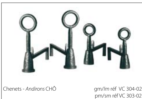
Chenets - Andirons CHÔ