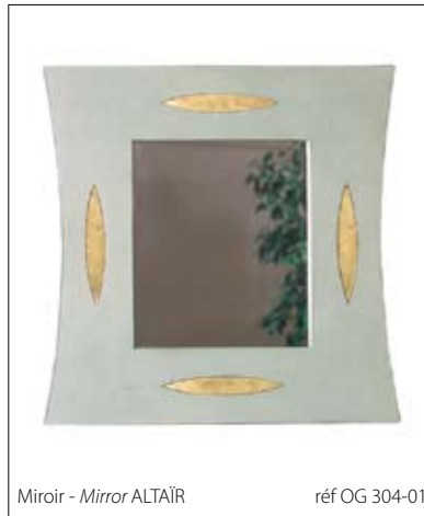
Miroir - Mirror ALTAIR réf OG 304-01