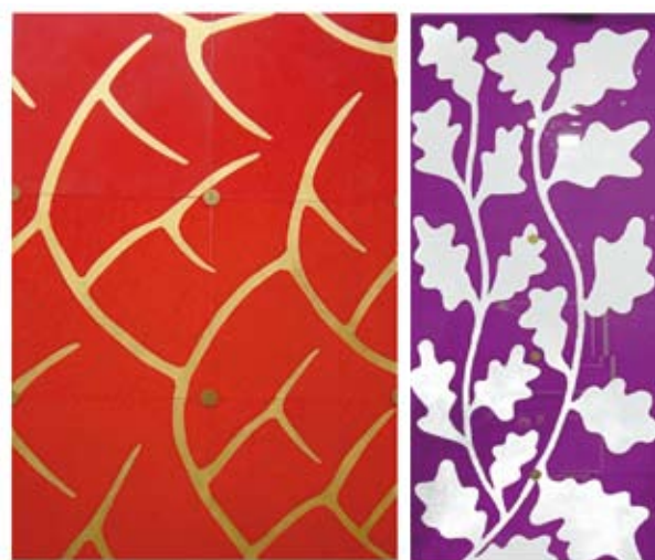
Décor peint à la main sous verre - Hand painted pattern on glass ( detail) DIX HUIT réf VC 518 / DIX NEUF réf VC 519

Autres dimensions sur demande / Any specific sizes on request