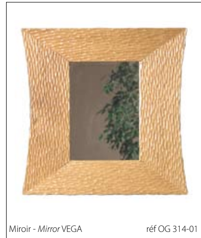
Miroir - Mirror VEGA réf OG 314-01