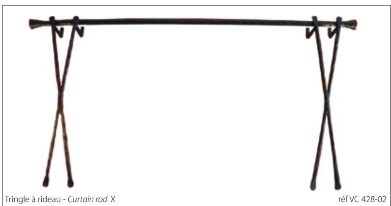
Tringle à rideau - Curtain rod X