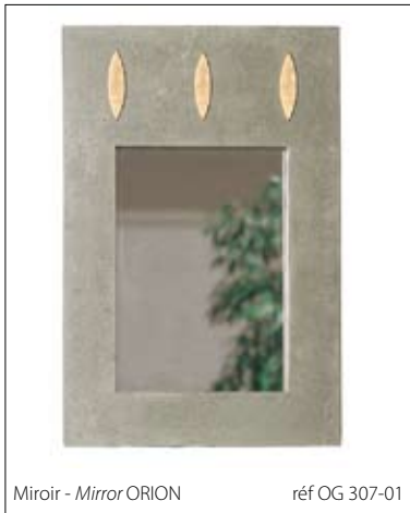
Miroir - Mirror ORION réf OG 307-01