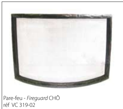
Pare-feu - Fireguard CHÔ réf VC 319-02