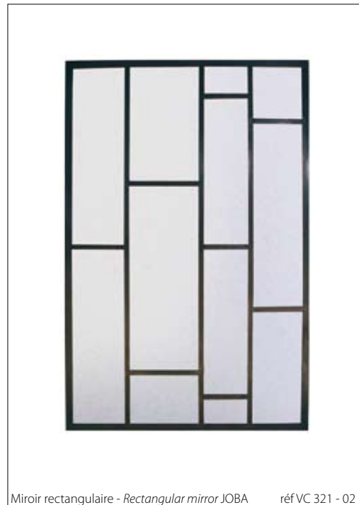
Miroir rectangulaire - Rectangular mirror JOBA réf VC 321 - 02