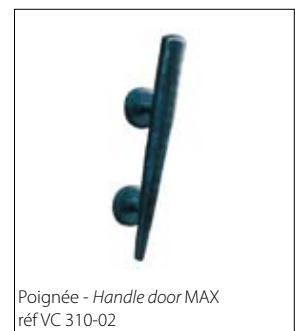
Poignée - Handle door MAX réf VC 310-02

Autres dimensions et finitions sur demande / Any specific sizes and types of finish available on request