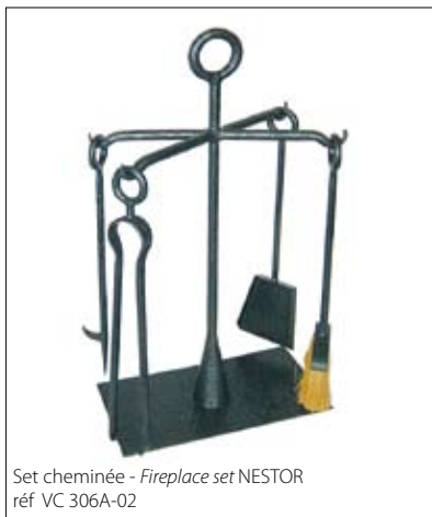
Set cheminée - Fireplace set NESTOR réf VC 306A-02